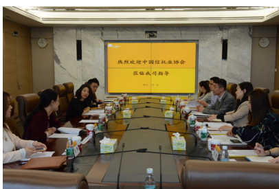
中国信托业协会领导到华润信托调研