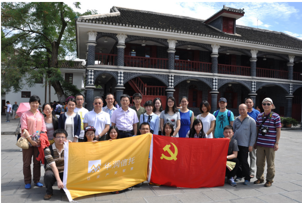
华润信托组织革命传统教育活动

(1) 传扬长征精神。2016 年是中国工农红军长征胜利 80 周年，为了发扬红军的长征精神，公司在开展“七·一”建党纪念活动中，组织党员干部前往遵义会议旧址等革命圣地参观学习，接受革命传统教育。