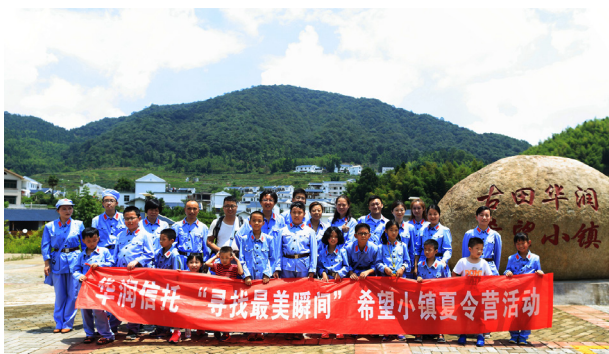
华润信托组织希望小镇夏令营活动

经过参观古田会议旧址、摄影培训、拓展训练、篝火晚会等一系列活动，家长和孩子们度过了充实而有意义的三天美好时光，收获了欢乐、友情和知识。“和孩子度过了非常有意义的三天，希望以后多组织这样的活动”，客户对本次夏令营活动赞赏不已。