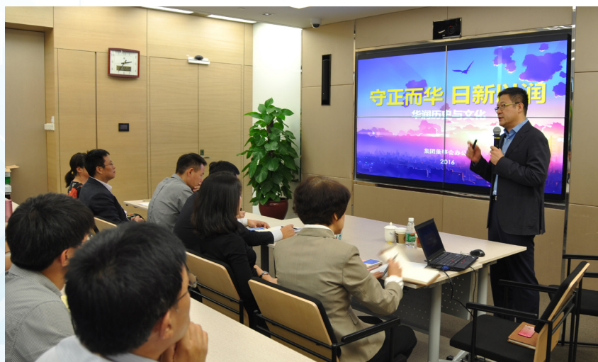
华润历史与文化宣讲

文化培训，使员工更加清楚地了解华润的企业历史、文化、战略发展目标，并将其融入到符合自身定位的工作期望、规范和行为模式中，通过文化理念的宣贯传递价值理念和行为规范，增强团队凝聚力和文化感染力。