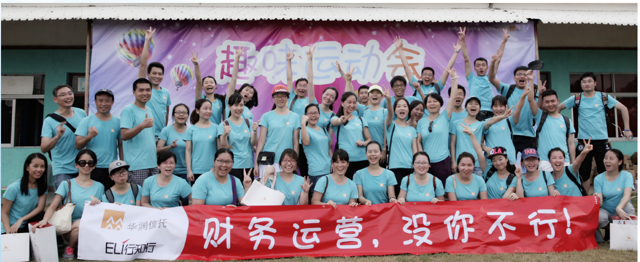
华润信托举办趣味运动会

2. 为了鼓励员工加强锻炼身体，公司工会组织员工，组成网球、足球、游泳、等体育活动兴趣小组，开展全员健康活动。华润信托派员组队参加“深圳金融系统职工羽毛球比赛”，取得好成绩。篮球兴趣小组经常活跃于周边居民小区，自发地用业余时间与小社区居民联动，举办友谊比赛，在锻炼身体的同时，展现了华润信托员工的风采，加强了企业与民众的沟通，促进公司业务发展。