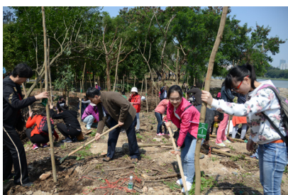
华润信托员工参加植树活动