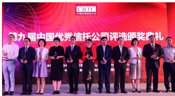
华润信托获得“优秀信托公司”奖

(一) 7月15日，由证券时报主办的第九届中国优秀信托公司颁奖典礼暨信托业高峰论坛在上海举行，华润信托再度摘得“中国优秀信托公司”奖。中国优秀信托公司奖旨在表彰在业务收入、资产状况、产品创新、风险控制等方面具有综合领先优势的卓越信托公司。依托强大的股东背景和雄厚的资金实力，华润信托一直位列信托行业第一梯队，始终坚持客户导向、持续创新，形成了独特的专业专长。