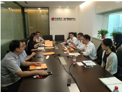
华润信托领导与金融同行交流