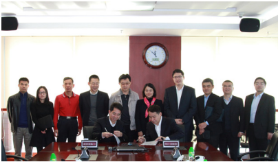
华润信托与深圳高新投签订战略合作协议