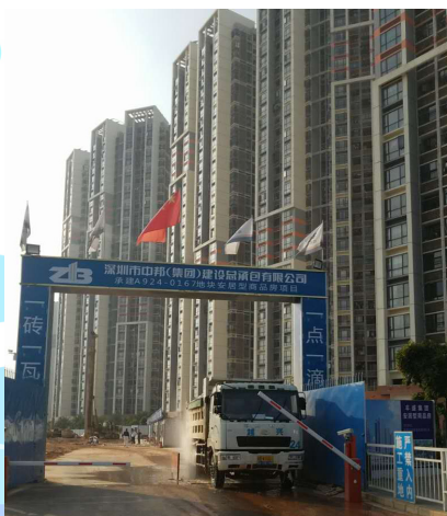
华润信托基金投向观澜保障房项目

华润信托积极与深圳市政府协同“加大保障性安居工程建设力度”，2016年华润信托设立乾诚4号私募投资基金，基金投向深圳市观澜的保障性住房项目建设，规模约21亿元。该项目属于工业用地改保障房用地，已取得深圳市住房保障署下发的《宗地号：A924-0167 地块安居型商品房建设和管理任务书》批文通知。根据批文通知的要求，本项目安居型商品房总面积为11.8万m 2 ，安居型商品房不低于1700套。华润信托通过对该项目的深度参与和管理，助力深圳市保障性住房建设，对于深圳市委市政府落实“五大发展理念”、推进供给侧结构性改革、吸引和集聚人才、保障和改善民生、扩大投资稳增长都有着重要意义。