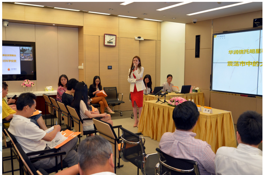
华润信托投资明星策略会

公司2016年度共进行了六次明星策略会，邀请明星私募基金大岩、源乐晟等与客户分享产品信息、市场分析并提供资产配置建议，得到与会客户一致好评。同时，公司也积极组织开展希望小镇夏令营、健康讲座等投资者活动，为客户提供健康规划等增值服务。