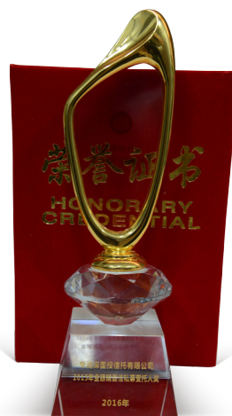
华润信托获得“金眼睛最佳私募受托人奖”

(三) 今年5月，公司在中国证券报·金牛理财网举办的2015年度“金牛理财产品”评选中荣膺“2015年度金牛资本市场服务信托公司奖”称号，市场地位广受业内认可。