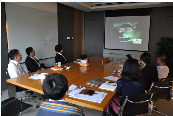
华润信托组织观看反腐教育片

(2) 公司组织员工学习观看警示教育片，加强党风廉政建设，提高拒腐防变能力，作风建设永远在路上。