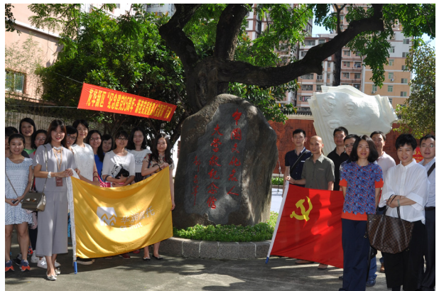
华润信托组织参观大营救纪念馆

当年华润集团的前身“联和行”的前辈们，怀着对党无限的忠诚和对革命胜利坚定的信念，克服艰难险阻，积极配合大营救行动，协助解决经费等问题，为成功大营救作出了重大贡献。