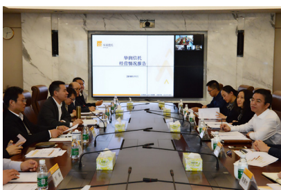
深圳银监局领导到华润信托调研

公司自觉维护行业整体利益，不采取恶意压价，降低服务标准或提供回扣等违法手段参与市场竞争。签署并自觉遵守由中国信托业协会组织签署的《信托公司开展资产证券化业务自律公约》，承诺公司将严格遵守公约的各项要求，自愿接受中国信托业协会的自律管理，发挥业务主导作用。全程参与业务，并从组织机构、业务制度、决策流程、风险管理、内部控制等方面加大投入以保障业务顺利实施，切实提高自主管理资产证券化业务的能力和水平，从而为实现行业健康可持续发展，维护信托行业整体利益作出应有的贡献。