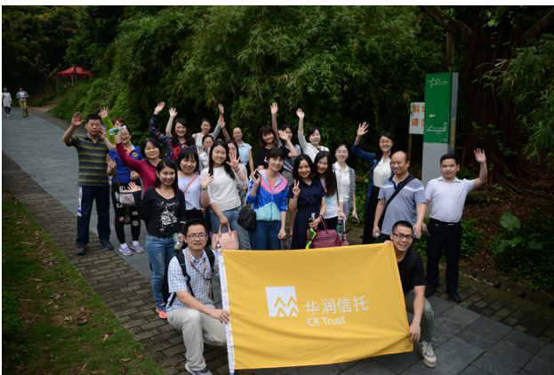
华润信托组织员工郊野徒步、骑车活动

体育锻炼活动提高了员工的抗病能力，调节繁重的工作压力，舒展身心，陶冶情操，保持健康的心态，从而提高自信心和价值观，使个性在融洽的氛围中获得健康、和谐的发展。团队竞赛活动也培养人的团结、协作及集体主义精神，有效提高工作效率。