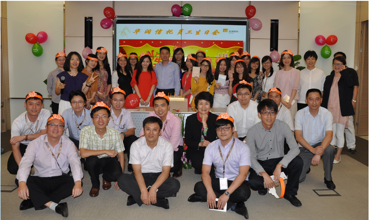
华润信托举办健康讲座