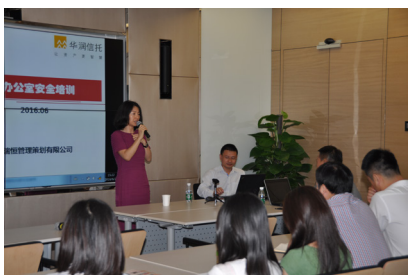
华润信托举办安全培训

公司贯彻“安全第一、预防为主、综合治理”的安全生产方针，认真落实集团安全生产“十三五”规划。积极开展安全生产管理各项工作，全体员工上下努力，继续推进具有“华润特色的价值创造型安全生产管理体系”建设与实施。紧密结合行业特点，加强安全生产工作的领导、明确安全生产责任。落实安全生产责任制，按经营管理权归属划分，层层签订安全生产责任书，分级承担责任、化解风险，形成“横向到边、纵向到底”的责任体系。安全生产各项防范措施得以落实，全年未发生任何安全责任事故，圆满完成各项目标任务。连续多年无安全责任事故，为公司经营和管理工作的顺利开展提供了有效的安全支撑，为股东、为公司、为员工创造最大价值提供了有效的保障。