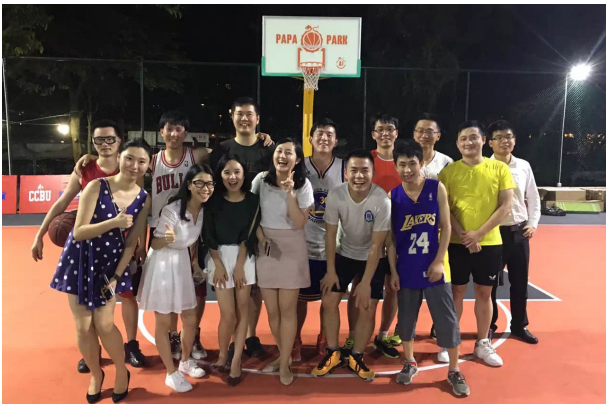
华润信托篮球俱乐部活动