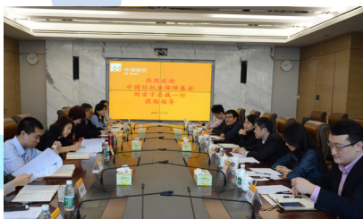
中国信托业保障基金公司领导到华润信托调研

(1) 华润信托在经营活动中坚定维护金融市场秩序，特别是在加强金融法制建设，降低与预防金融领域的违法犯罪、防范金融风险作出不懈的努力。公司在金融市场各种交易中，事先进行规范性程序设计，采用规范程序与制度建设，辅助技术措施，预防各种经营风险；同时，对从业人员，特别是管理人员进行金融法制教育，增强金融法制观念与金融职业操守的自律。