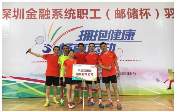
华润信托参加羽毛球比赛