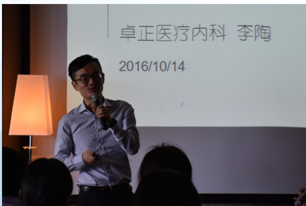
华润信托举办健康讲座